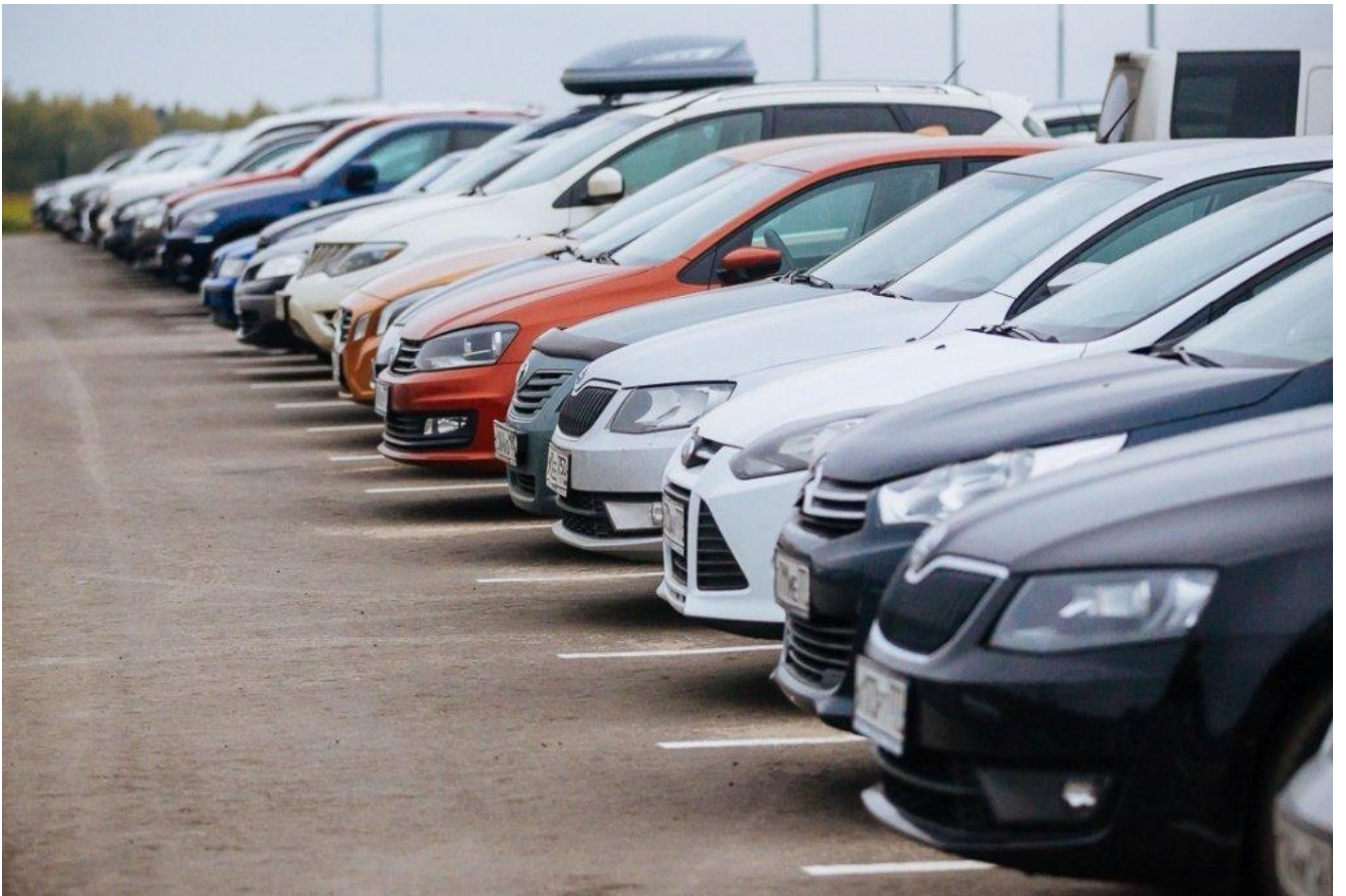
Ремонт автомобильных парковок