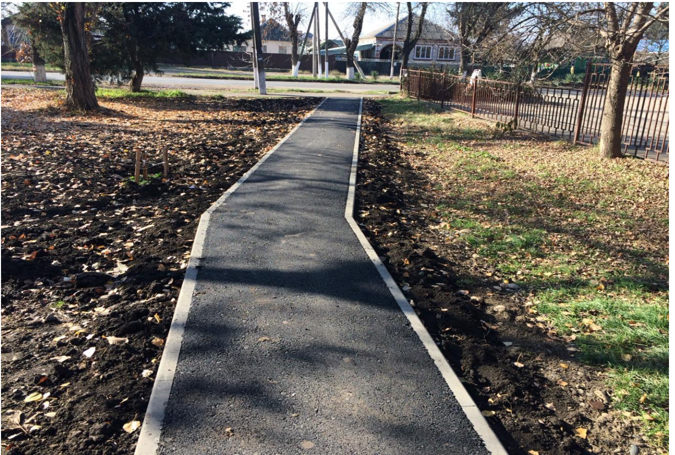
Ремонт тротуаров, пешеходных дорожек