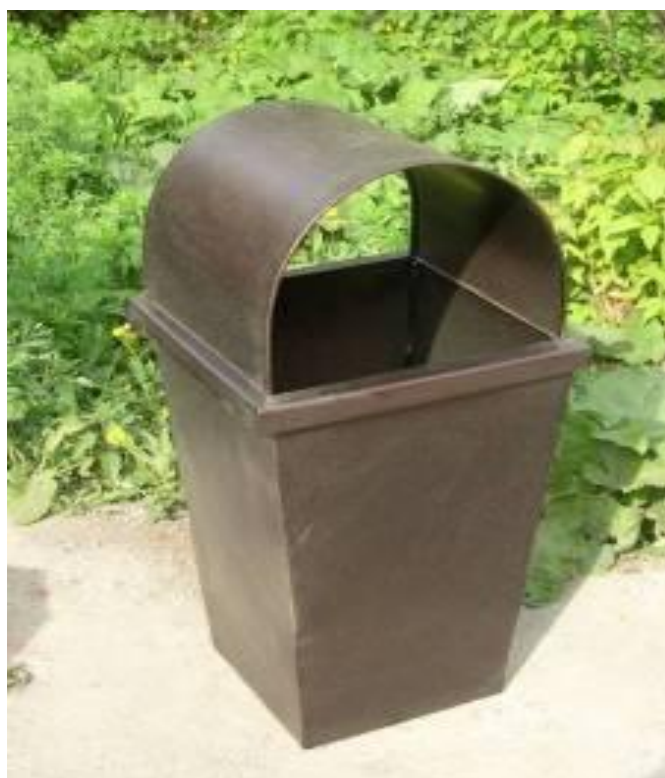
Урна УП-1, для установки