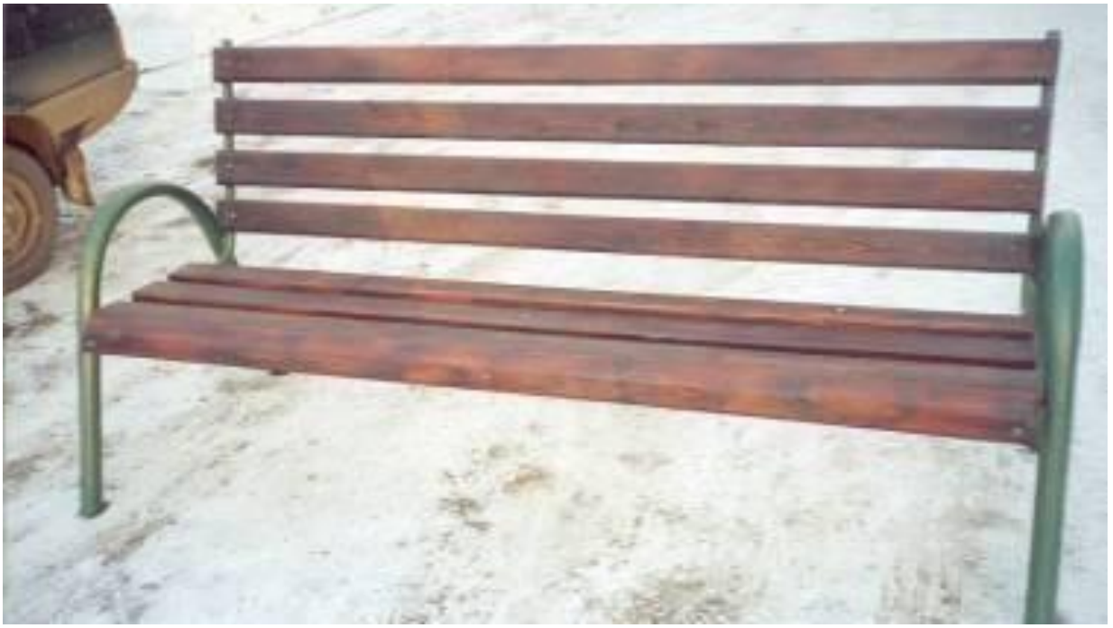
Скамья для установки