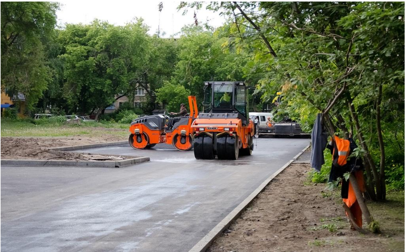
Ремонт дворовых проездов