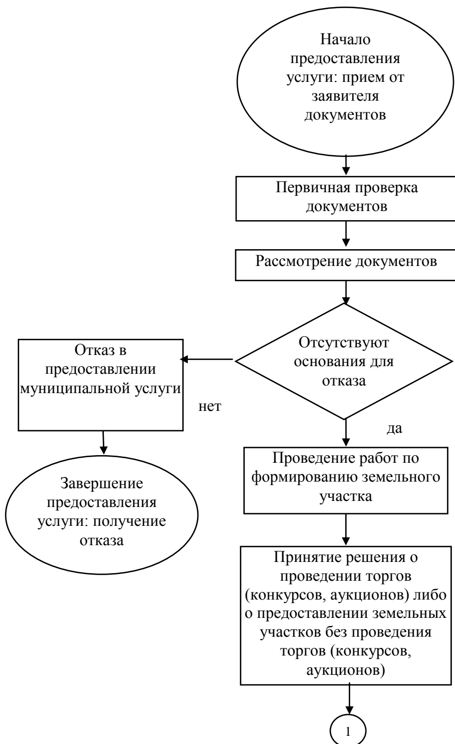
Блок-схема N 1 Предоставление земельного участка для строительства без предварительного согласования мест размещения объектов